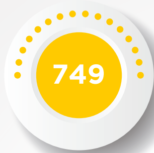
PENSIÓN POR VEJEZ