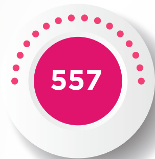
SEPARACIÓN DEL SISTEMA