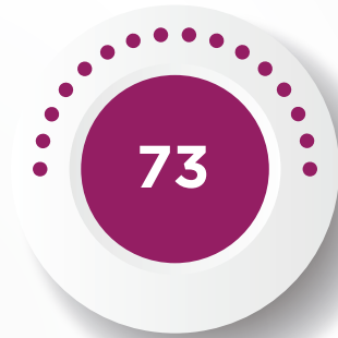
PENSIÓN POR AUXILIO DE INVALIDEZ