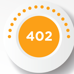
CONTINUACIÓN DE JUBILACIÓN Y PENSIÓN