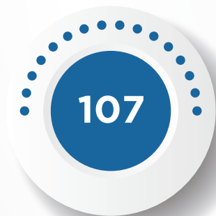
PENSIÓN POR VIUDEZ Y ORFANDAD